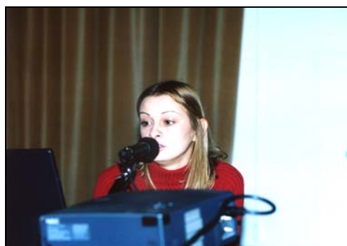
Alcuni momenti delle tre conferenze.