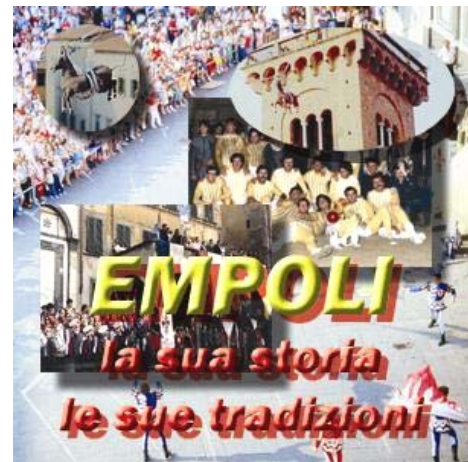
La copertina del CD-ROM