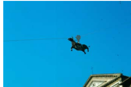
il volo del ciuco

Durante gli incontri tra i partecipanti si è riaccesa quella passione e vivo interesse verso tradizioni per lo più dimenticate ma che hanno segnato la storia di Empoli nel corso dei secoli; nella ricerca della documentazione, grazie all'apporto dei nostri soci, si sono anche riscoperte alcune particolarità e rarità che verranno divulgate all'interno del CD-ROM , e delle quali vi daremo anticipazioni nei prossimi numeri del notiziario.