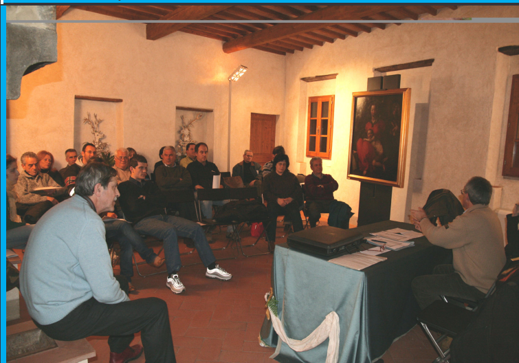
La riunione per l'approvazione del bilancio 2007 svoltasi alla casa del Pontormo a Pontorme

Tutti coloro che sono interessati a partecipare sono pregati di mettersi in contatto con l'associazione.