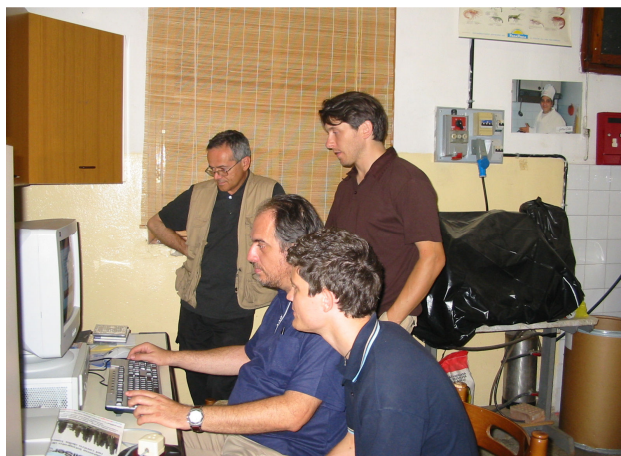
La redazione di INFORMA al lavoro

I soci sono avvisati, tenetevi pronti, questo sarà un anno memorabile per noi..... si farà le fa'ille!!